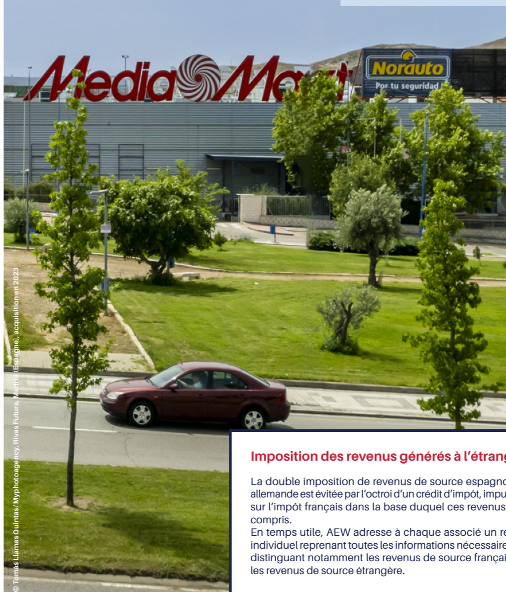
© Tomas Llamas Quintas / Myphotoagency, Rivas Futura, Madrid (Espagne), acquisition en 2023