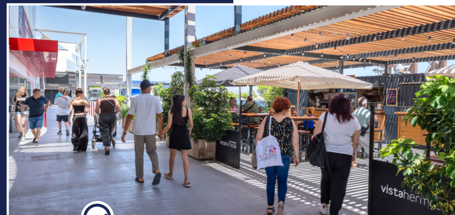
© Francisca Zamora Lopez / Myphotoagency, Vistahermosa, Alicante (Espagne), acquisition en 2023

AEW Opportunités Europe, avec son prix de part accessible et très bien positionné par rapport à la valeur du patrimoine détenu, fournit aux épargnants un point d'entrée intéressant dans l'immobilier européen.