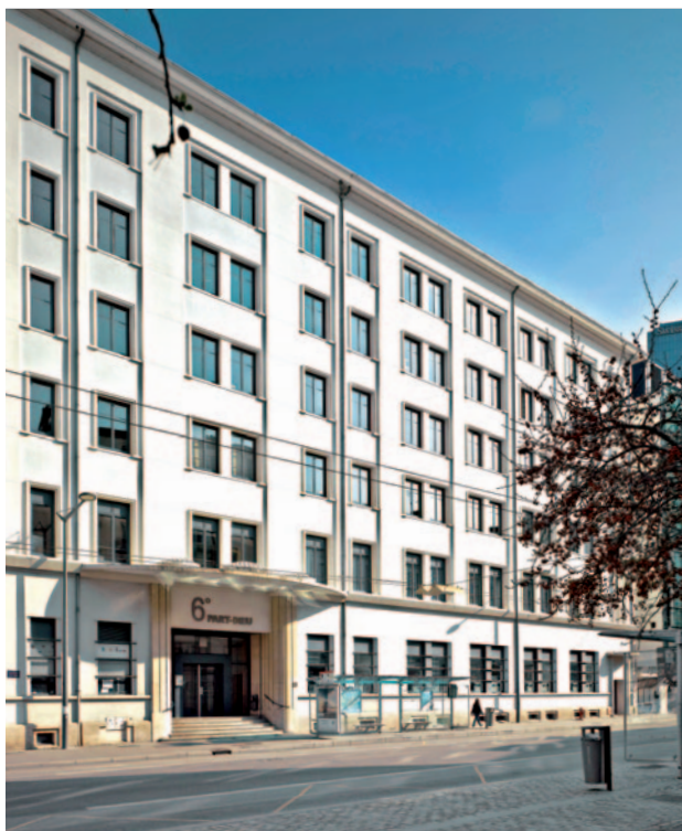
23, boulevard Jules Favre • Lyon (69)