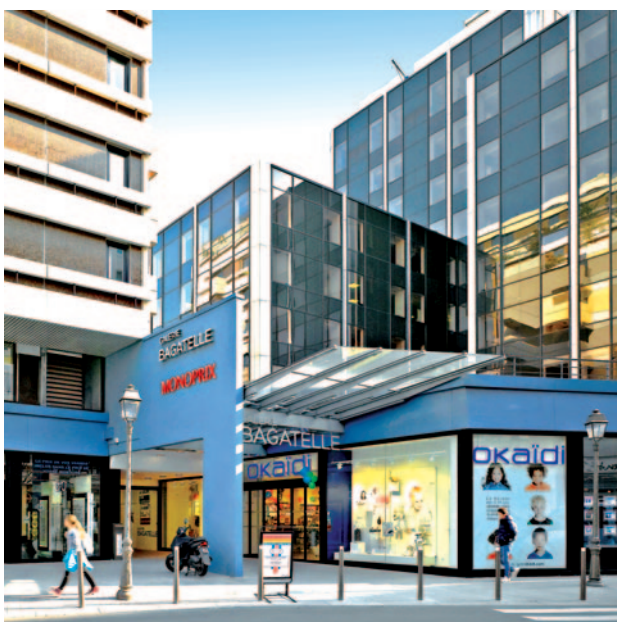
4 bis, rue des Bourets • Suresnes (92)

Derrière la stabilisation de l'offre immédiate de bureaux en Ile-de-France autour de 3,6 millions de m 2 s'opère une légère recomposition du stock vacant avec, d'un côté, une contraction de l'offre de grand gabarit (-4 % en 3 mois) et, de l'autre, un accroissement (+7 % au 1 er trimestre 2017) des surfaces de taille intermédiaire (de 1000 à 5000 m 2 ). Chacune de ces catégories représente 1,4 million de m 2 immédiatement disponibles à fin 2016.